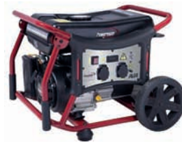
WX 2200 (Pramac)