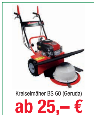
Kreiselmäher BS 60 (Geruda)