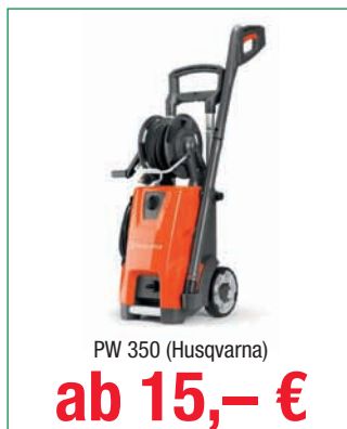
PW 350 (Husqvarna)