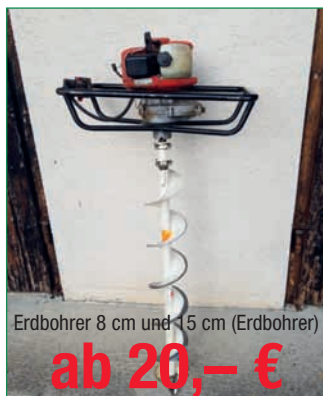
Erdbohrer 8 cm und 15 cm (Erdbohrer)