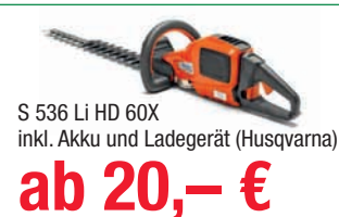
S 536 Li HD 60X inkl. Akku und Ladegerät (Husqvarna)