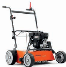
S 500 Pro (Husqvarna)