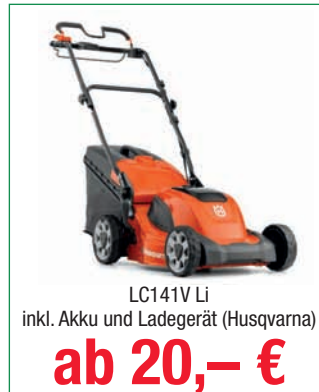
LC141V Li inkl. Akku und Ladegerät (Husqvarna)