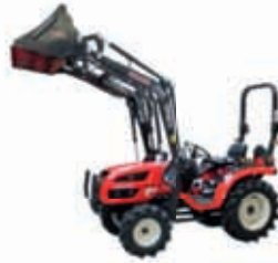
2900h inkl. Frontlader