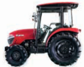
5025C 6225C 6225CH