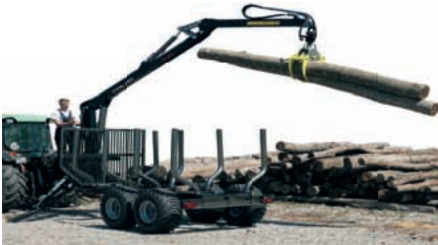
Forstanhänger mit Kran

Alle Preise verstehen sich inkl. 19% Mehrwertsteuer, exkl. Überführungskosten.