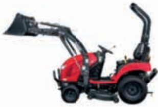
1905h inkl. Frontlader & Mähwerk