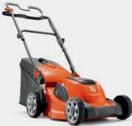
AKKU-RASENMÄHER LC 141Li