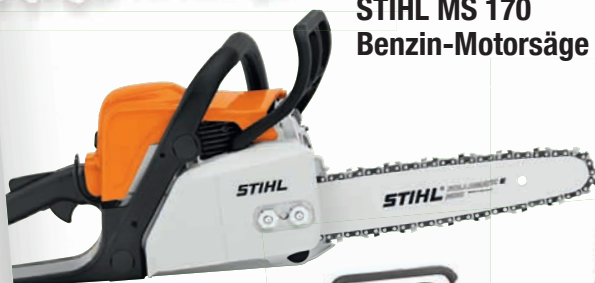
STIHL MS 170 Benzin-Motorsäge